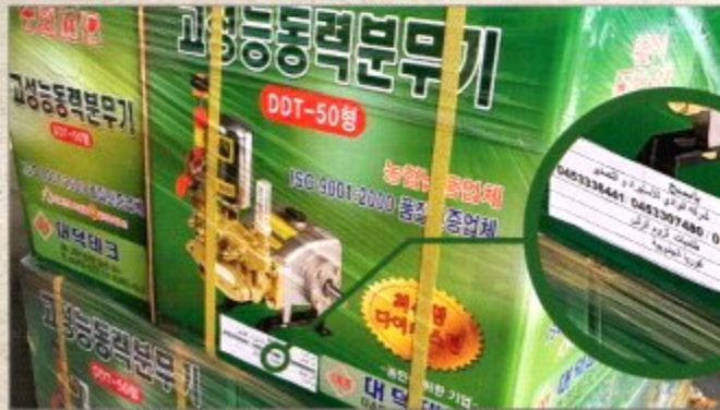
해외 수출 DDT-50