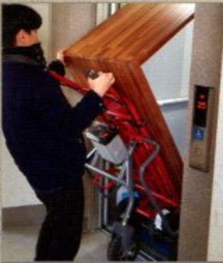
가구 운반 DDT-H1