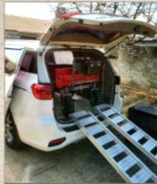
DDT-P3 카니발 적재